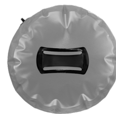
Bodenschleife zum Festhalten für einfaches Entleeren